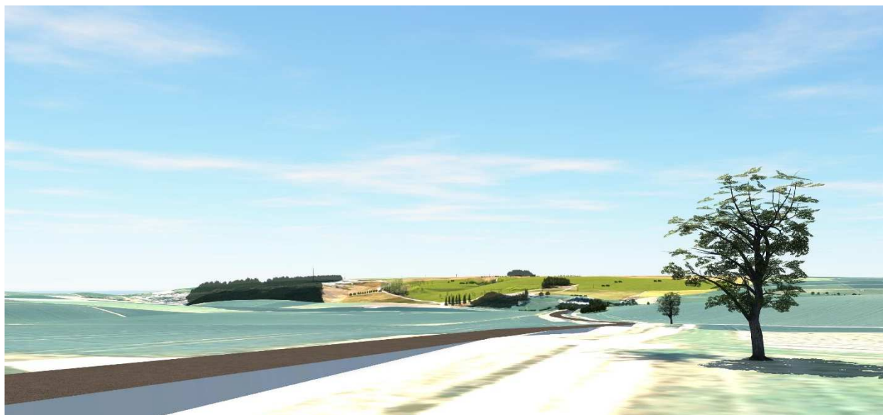
Nördlich des Abbaus