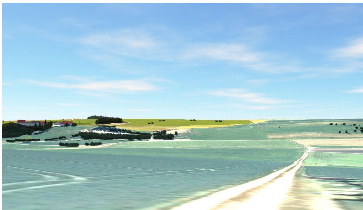
Westlich des Abbaus