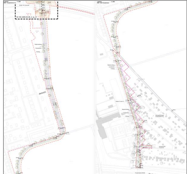
Abbildung 2: Neue Trassenlage RSV in der Feudenheimer Au