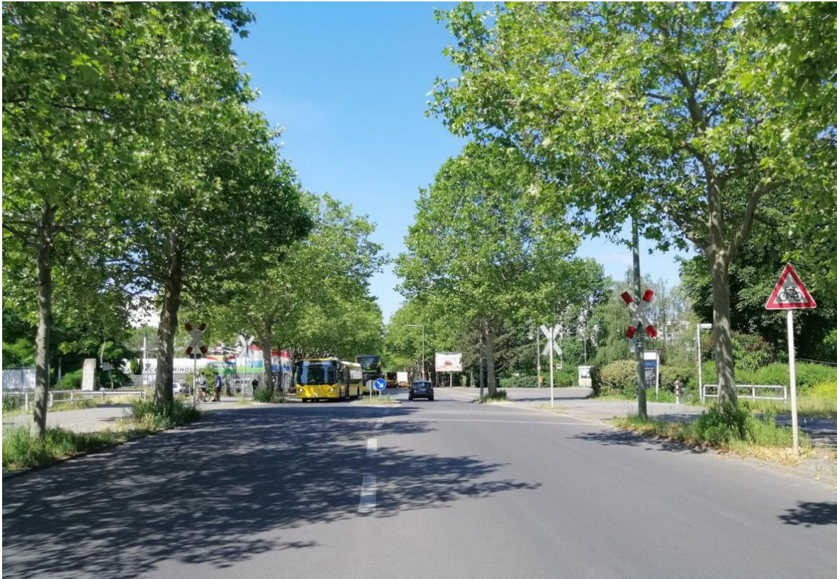
Abbildung 1: BÜ km 2,119 „Wilhelmsruher Damm“, Strecke 6501, Stadt Berlin Blick in Richtung Westen

Im Auftrag der DB Engineering & Consulting GmbH wurde eine Verkehrszählung am Bahnübergang km 2,119 „Wilhelmsruher Damm“ in der Stadt Berlin, auf der Strecke 6501 (Bln-Wilhelmsruh - Schönwalde) durchgeführt.