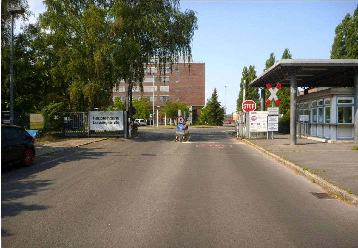
Abbildung 1: BÜ km 1,073 „Lessingstraße“, Strecke 6501, Stadt Berlin Blick in Richtung Westen

Im Auftrag der DB Engineering & Consulting GmbH wurde eine Verkehrszählung am Bahnübergang km 1,073 „Lessingstraße“ in der Stadt Berlin, auf der Strecke 6501 (Bln-Wilhelmsruh - Schönwalde) durchgeführt.