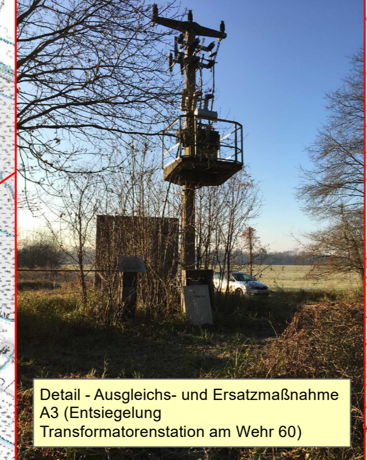
Detail - Ausgleichs- und Ersatzmaßnahme A3 (Entsiegelung Transformatorstation am Wehr 60)