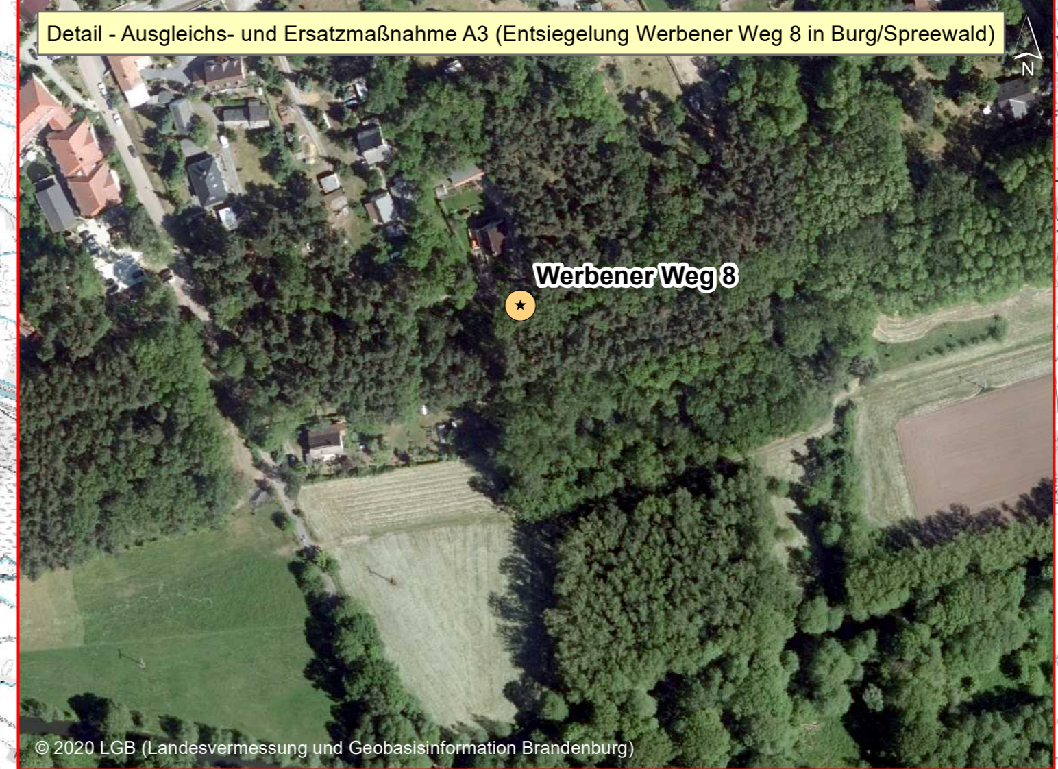
Detail - Ausgleichs- und Ersatzmaßnahme A3 (Entsiegelung Werbener Weg 8 in Burg/Spreewald)