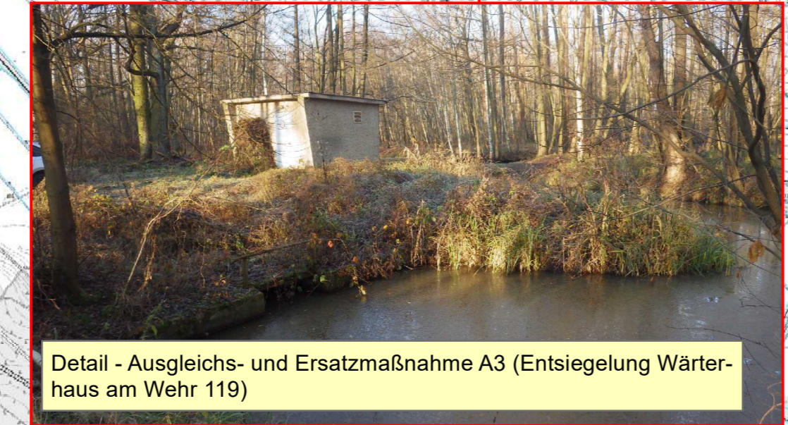
Detail - Ausgleichs- und Ersatzmaßnahme A3 (Entsiegelung Wärterhaus am Wehr 119)