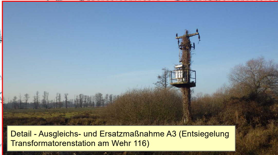
Detail - Ausgleichs- und Ersatzmaßnahme A3 (Entsiegelung Transformatorstation am Wehr 116)