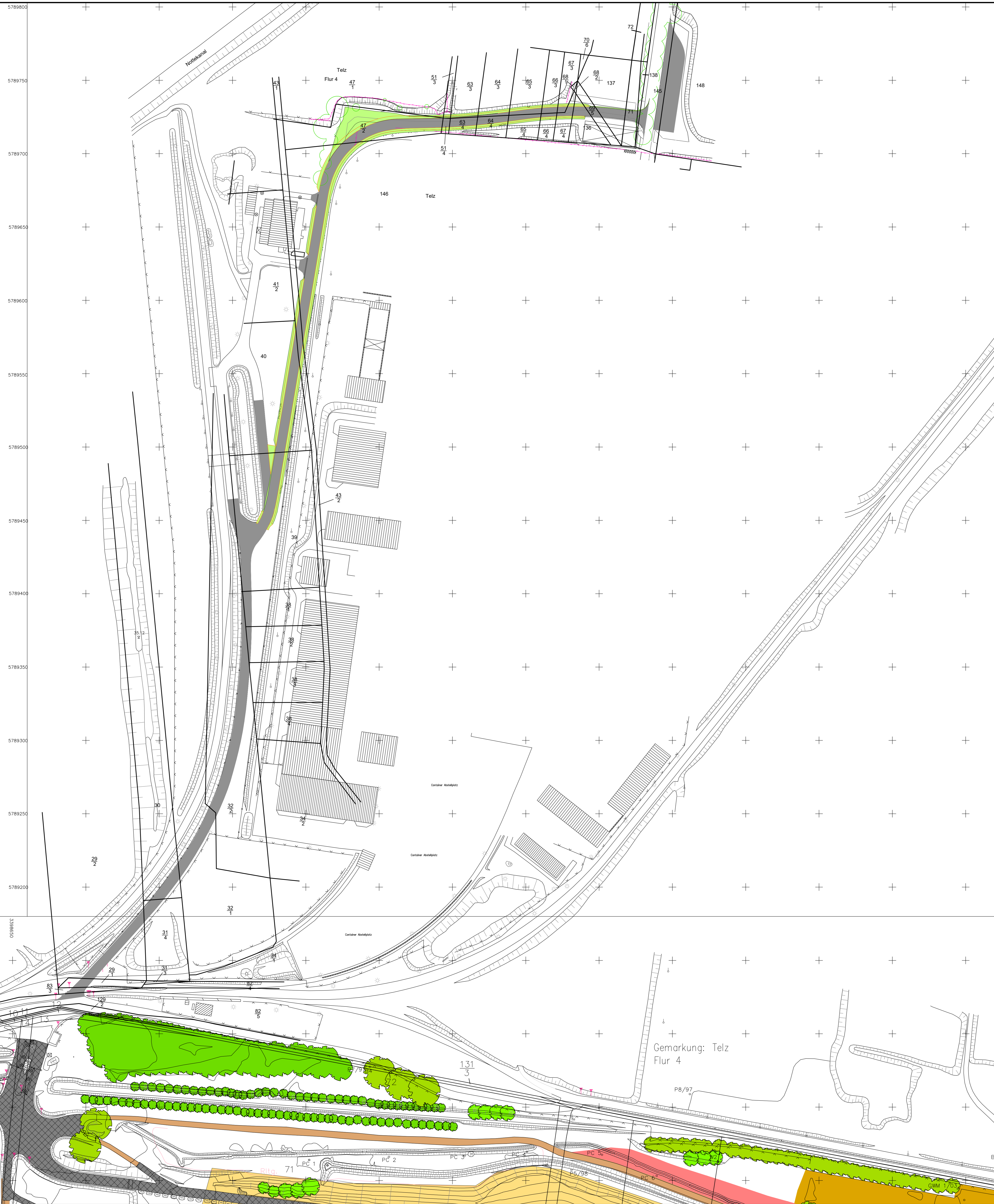
Ausschnitt topographischer Übersichtsplan