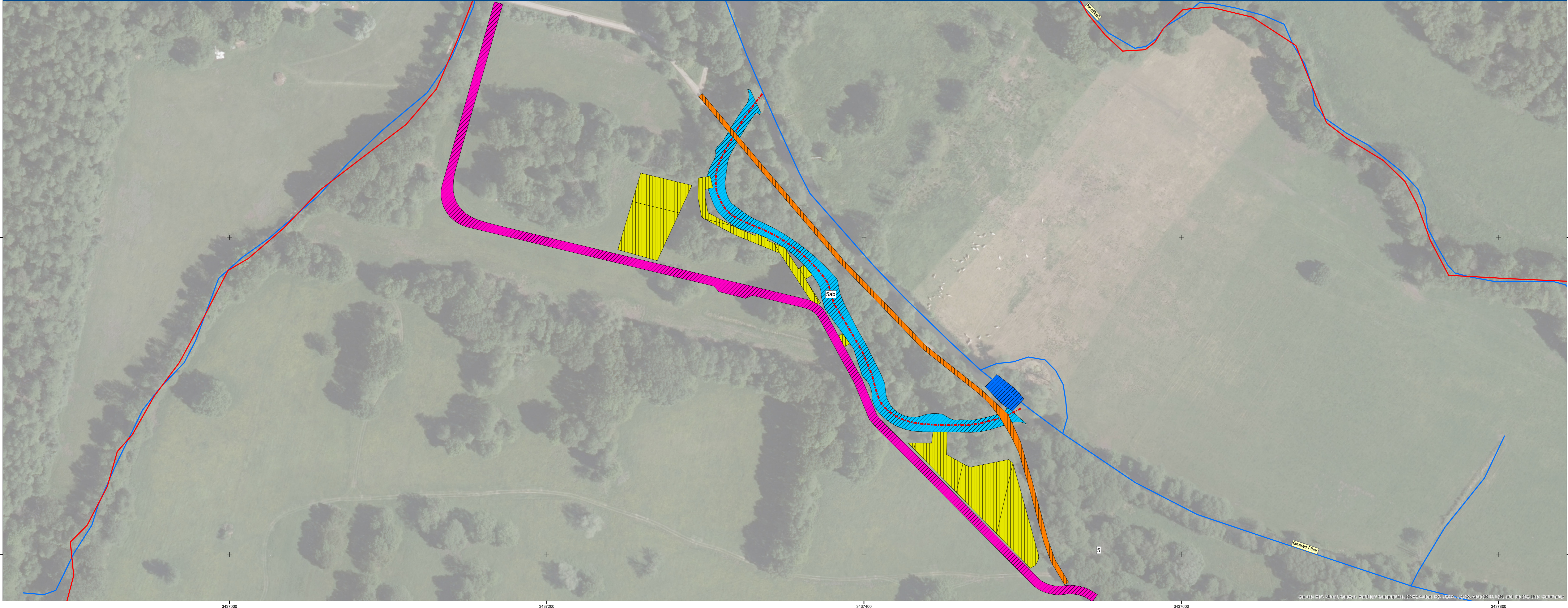
Los 2: Altarme 5a und 5b, Maßstab 1:1.000