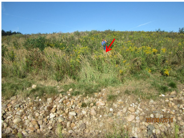
Ansichten zur Beprobung Berme, unten