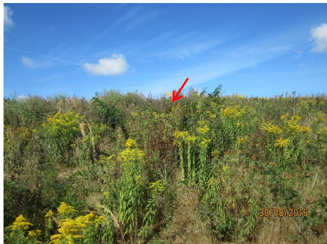
Ansichten zur Beprobung Berme, oben