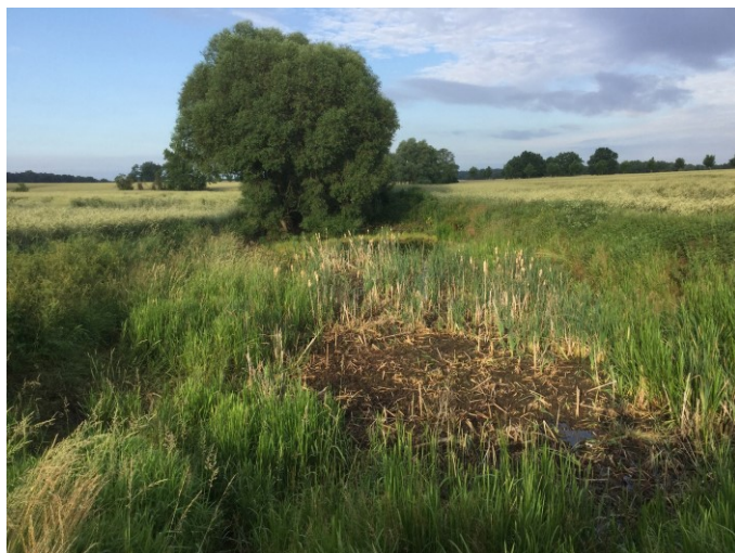
Abb. 3. Gewässer 1 am 25.06.2018.