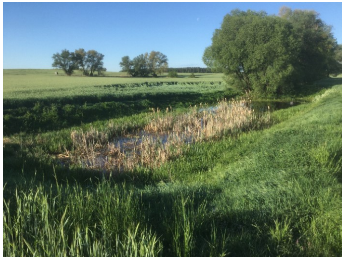
Abb. 2. Gewässer 1 am 12.05.2020.