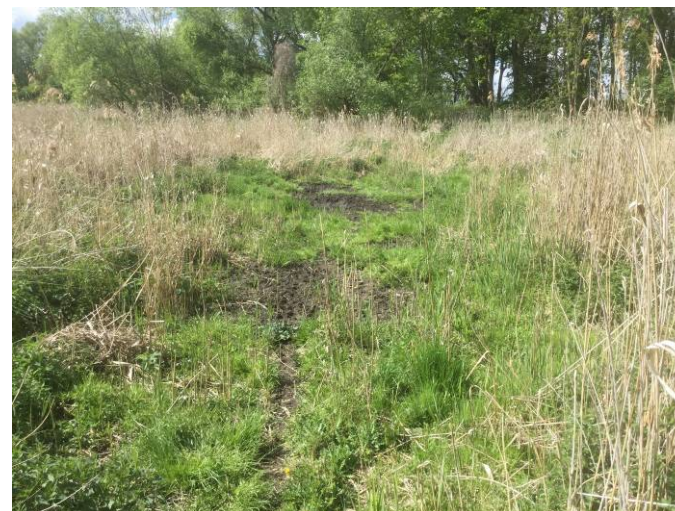
Abb. 12. Gewässer 7 (trocken) am 12.05.2020.