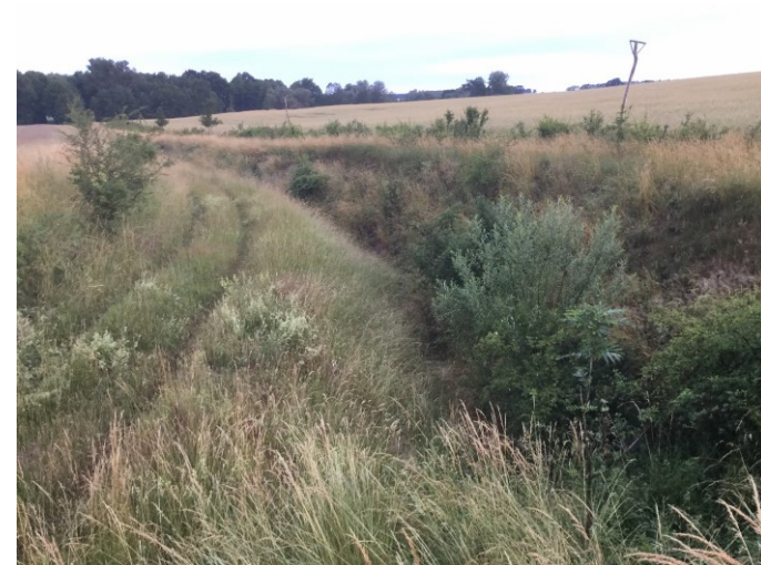
Abb. 16. Graben (trocken) westlich vom WEG am 25.06.2020.