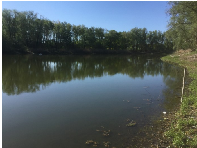
Abb. 6. Gewässer 2 am 12.05.2020.