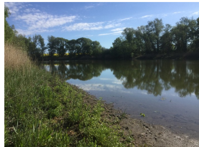
Abb. 5. Gewässer 2 am 12.05.2020.