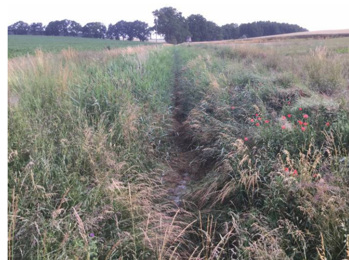
Abb. 17. Graben (fast trocken) westlich vom WEG am 25.06.2020.