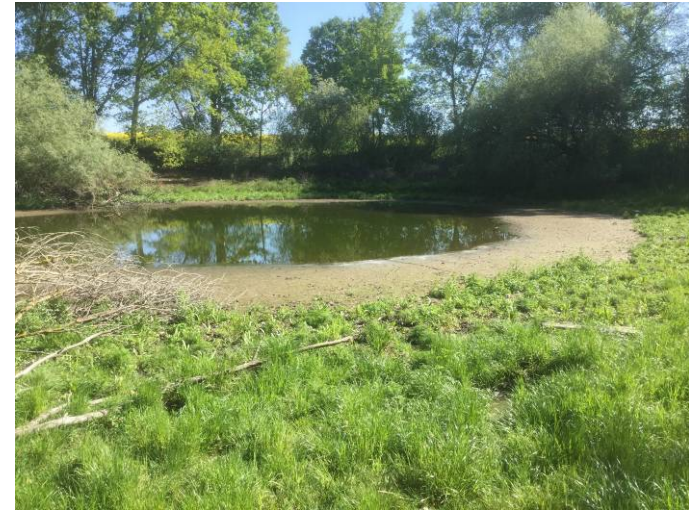
Abb. 8. Restwasserfläche von Gewässer 3 am 12.05.2020.