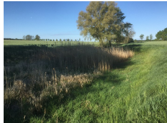
Abb. 9. Gewässer 4 (trocken) am 12.05.2020.