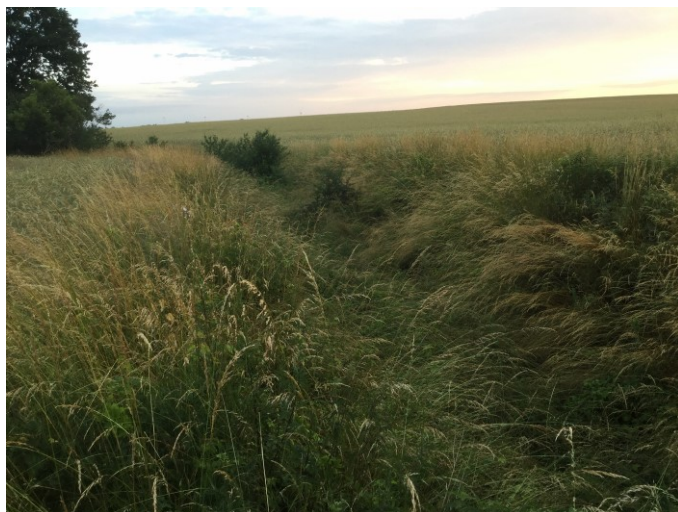
Abb. 15. Graben (trocken) am Westrand vom WEG am 25.06.2020.