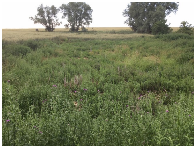
Abb. 10. Gewässer 5 (trocken) am 25.06.2020.