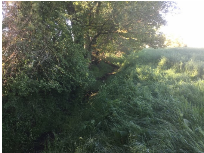
Abb. 14. Graben (trocken) im WEG am 12.05.2020.