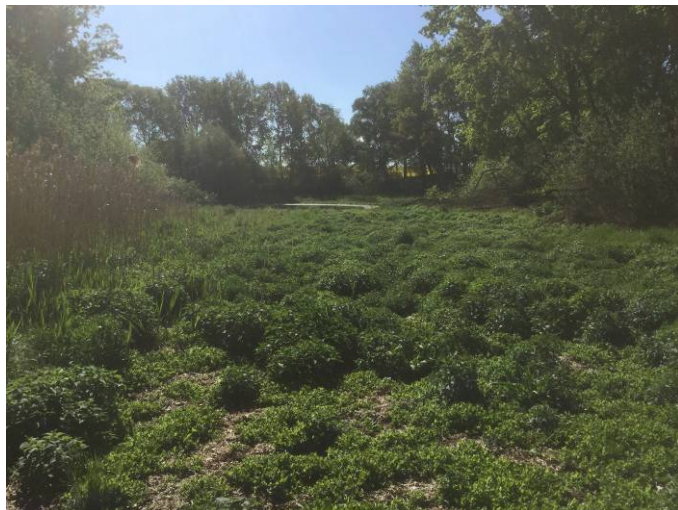
Abb. 7. Trocken liegendes Nordende des Gewässers 3 am 12.05.2020.