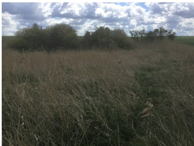
Abb. 11. Gewässer 6 (trocken) am 12.05.2020.