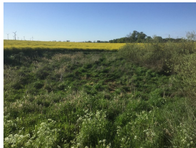
Abb. 13. Gewässer 8 (trocken) am 12.05.2020.