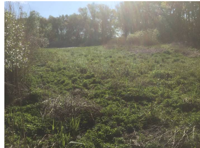
Abb. 4. Trocken liegendes Südende des Gewässers 2.