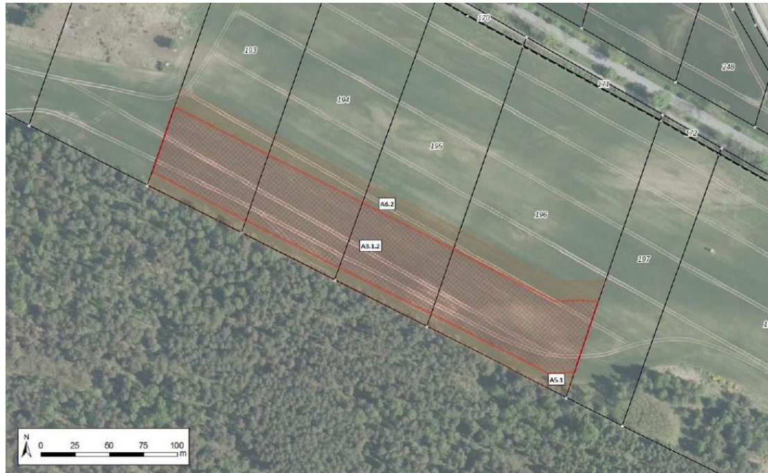
Abbildung 1-7: Lage der Maßnahme A3.1.2

Hinweis: Die oben dargestellte Ausgleichsfläche A5.1 aus dem Bebauungsplan BP-35-001 sind keine im Zuge des BlmSch-Verfahrens vorgesehene bzw. erforderliche Maßnahmenfläche.