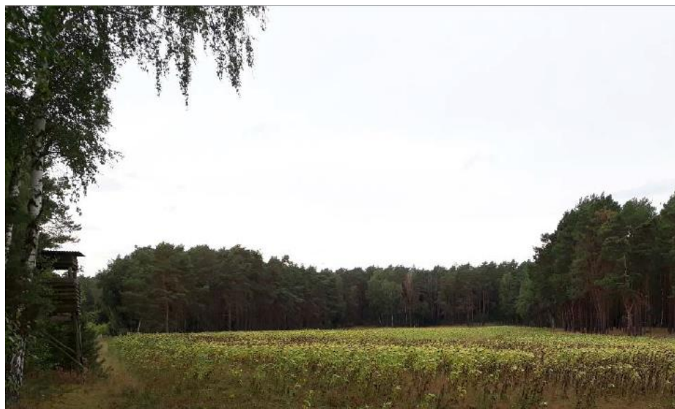
Abbildung 1-14: Ausgangssituation, Blickrichtung Nordwest

Hinweis: Die oben dargestellten Ausgleichsflächen A4.3, A5.3 und A5.4 aus dem Bebauungsplan BP-35-001 sind keine im Zuge des BImSch-Verfahrens vorgesehenen bzw. erforderlichen Maßnahmenflächen.