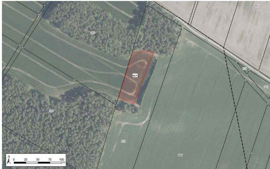
Abbildung 1-11: Lage der Maßnahme A3.4