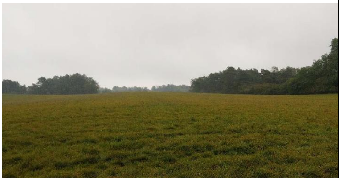
Abbildung 1-10: Ausgangssituation