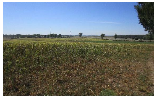
Abbildung 1-19: Ausgangssituation