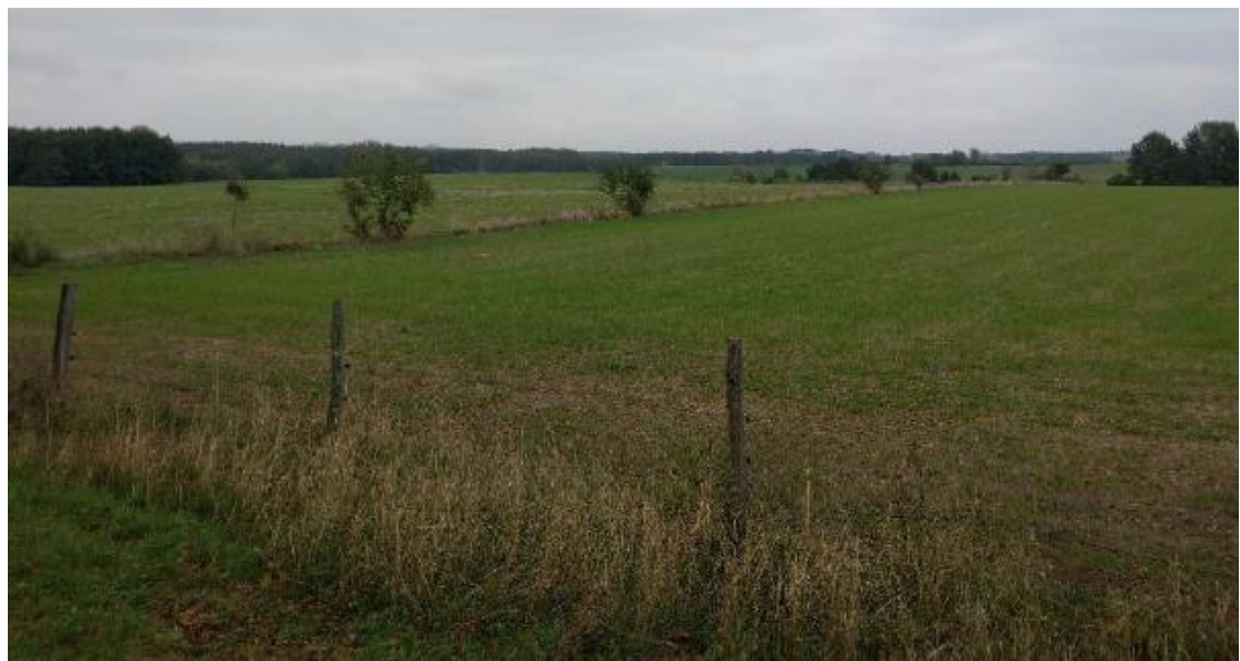
Abbildung 1-4: Ausgangssituation