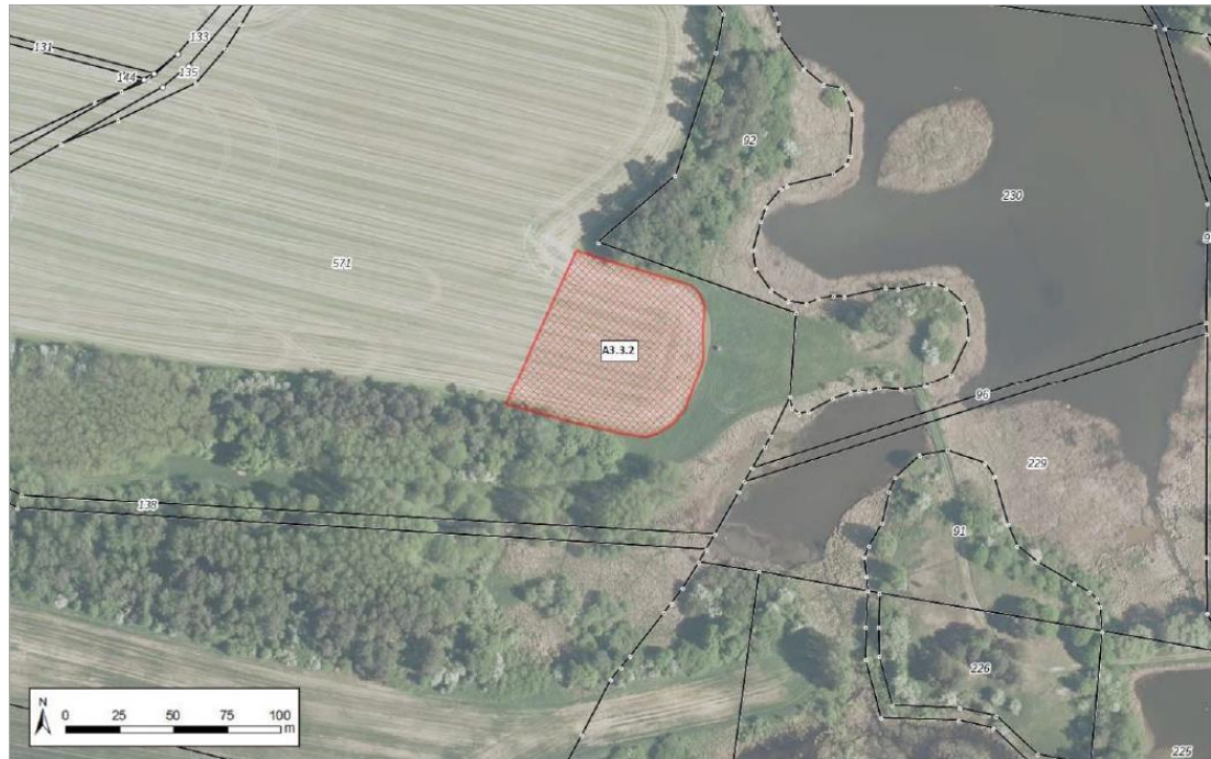
Abbildung 1-9: Lage der Maßnahme A3.3.2