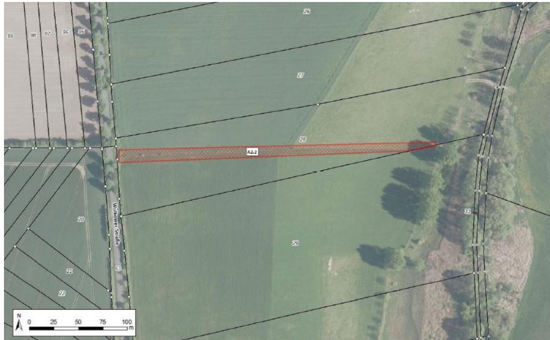
Abbildung 1-3: Lage der Maßnahme A2.1