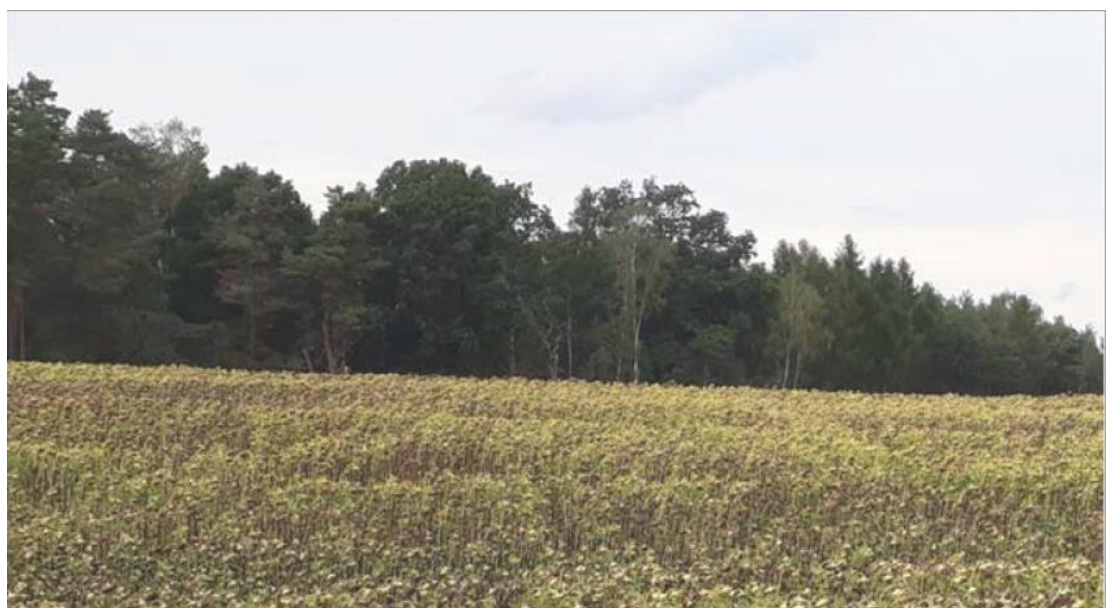
Abbildung 1-16: Ausgangssituation, Blickrichtung West

Hinweis: Die oben dargestellte Ausgleichsfläche A5.1 aus dem Bebauungsplan BP-35-001 ist keine im Zuge des BImSch-Verfahrens vorgesehene bzw. erforderliche Maßnahmenfläche.