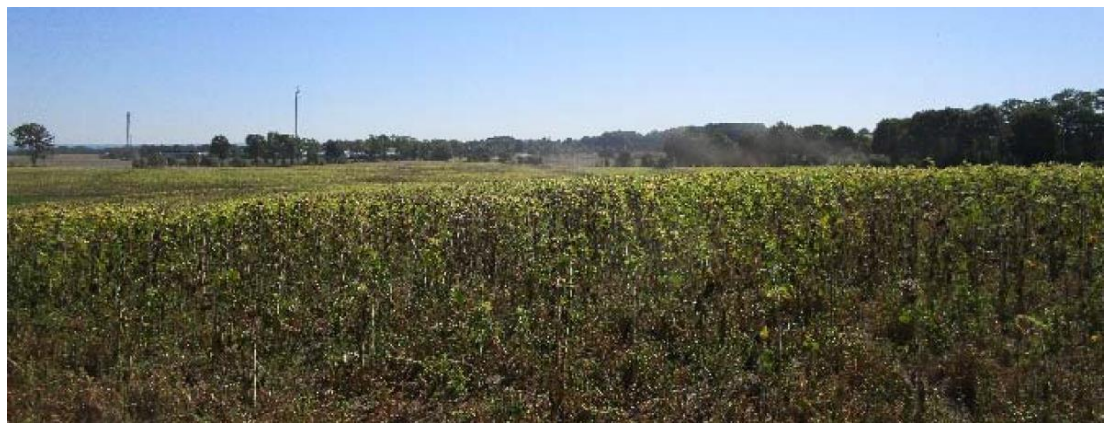
Abbildung 1-21: Ausgangssituation

Hinweis: Die oben dargestellte Ausgleichsfläche A5.4 aus dem Bebauungsplan BP-35-001 ist keine im Zuge des BImSch-Verfahrens vorgesehene bzw. erforderliche Maßnahmenfläche.