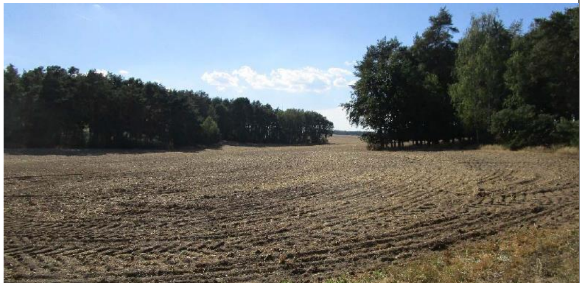
Abbildung 1-12: Ausgangssituation