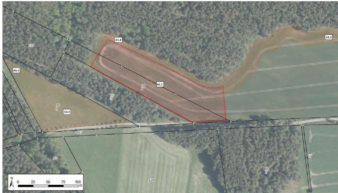
Abbildung 1-13: Lage der Maßnahme A6.1

Hinweis: Die oben dargestellten Ausgleichsflächen A4.3, A5.3 und A5.4 aus dem Bebauungsplan BP-35-001 sind keine im Zuge des BImSch-Verfahrens vorgesehenen bzw. erforderlichen Maßnahmenflächen.