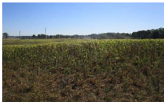
Abbildung 1-18: Ausgangssituation

Hinweis: Die oben dargestellten Ausgleichsfläche A5.4 aus dem Bebauungsplan BP-35-001 ist keine im Zuge des BImSch-Verfahrens vorgesehene bzw. erforderliche Maßnahmenflächen.