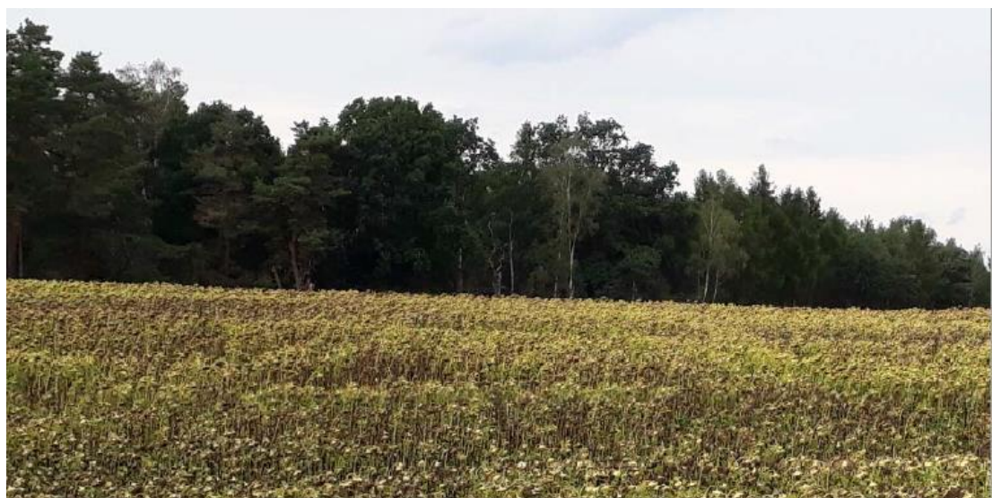
Abbildung 1-8: Ausgangssituation

Hinweis: Die oben dargestellte Ausgleichsfläche A5.1 aus dem Bebauungsplan BP-35-001 sind keine im Zuge des BlmSch-Verfahrens vorgesehene bzw. erforderliche Maßnahmenfläche.