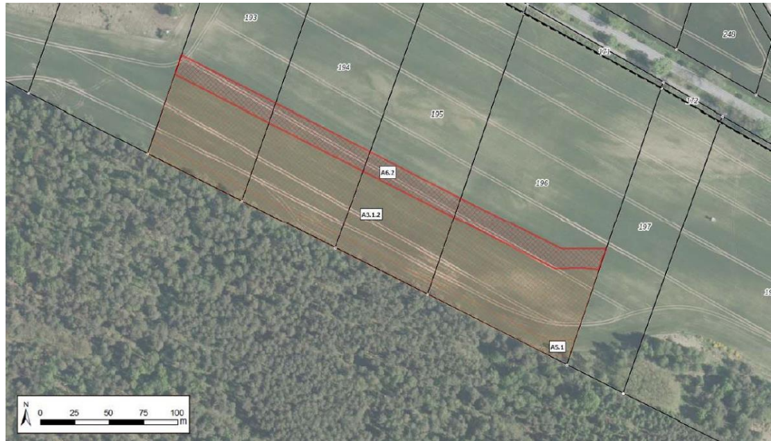
Abbildung 1-15: Lage der Maßnahme A6.2

Hinweis: Die oben dargestellte Ausgleichsfläche A5.1 aus dem Bebauungsplan BP-35-001 ist keine im Zuge des BImSch-Verfahrens vorgesehene bzw. erforderliche Maßnahmenfläche.