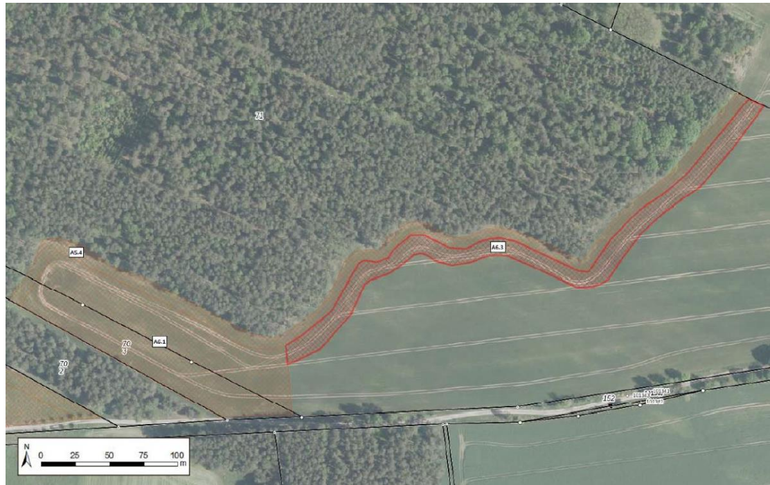
Abbildung 1-17: Lage der Maßnahme A6.3

Hinweis: Die oben dargestellten Ausgleichsfläche A5.4 aus dem Bebauungsplan BP-35-001 ist keine im Zuge des BImSch-Verfahrens vorgesehene bzw. erforderliche Maßnahmenflächen.