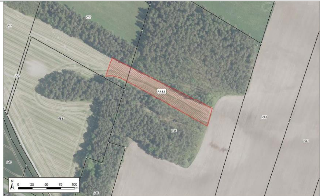
Abbildung 1-5: Lage der Maßnahme A3.1.1