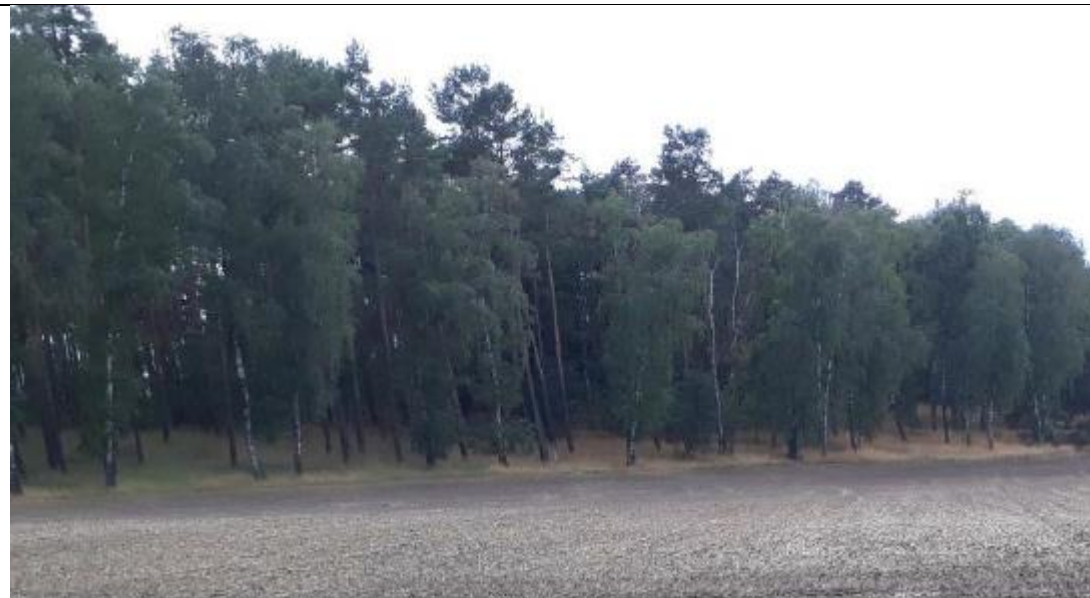
Abbildung 1-6: Ausgangssituation