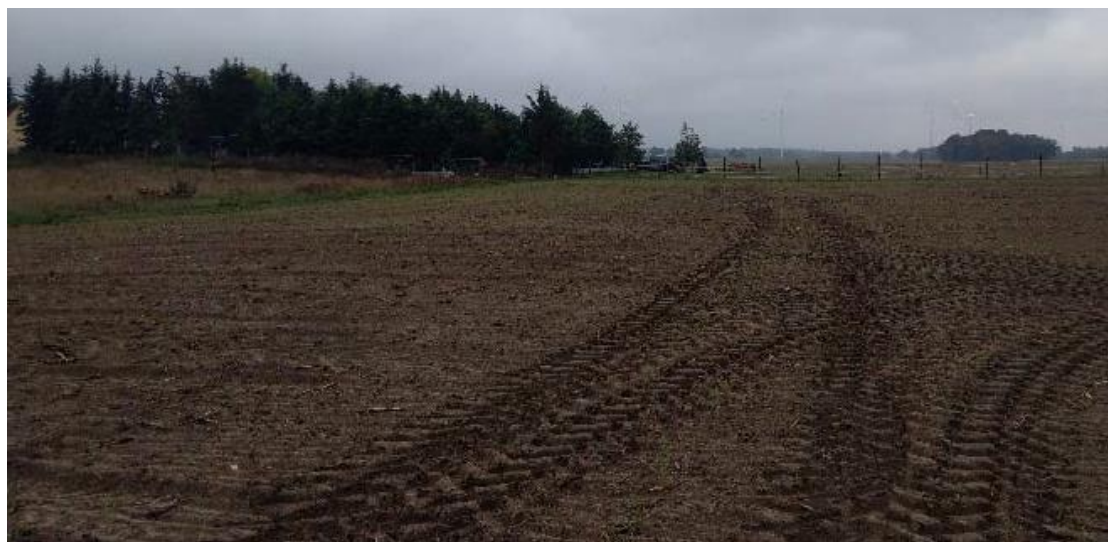
Abbildung 1-2: Ausgangssituation

Hinweis: Die oben dargestellten Ausgleichsflächen A3.2.2, A4.4.1, A4.4.2 und A4.4.3 aus dem Bebauungsplan BP-35-001 sind keine im Zuge des BImSch-Verfahrens vorgesehenen bzw. erforderlichen Maßnahmenflächen.