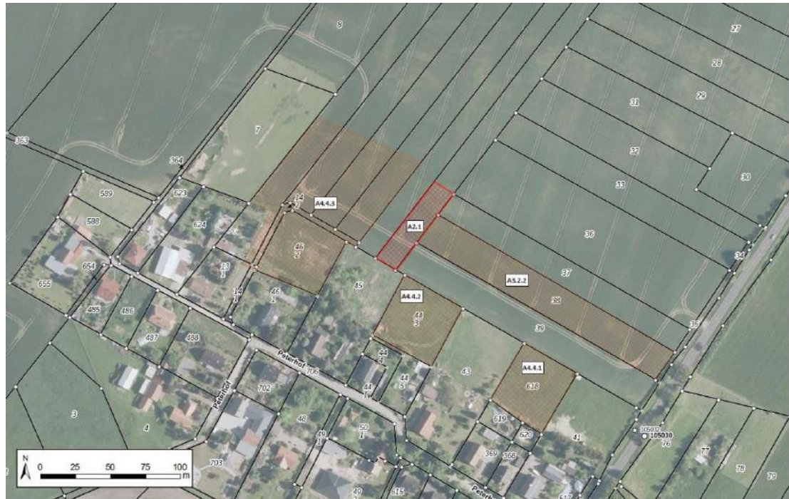
Abbildung 1-1: Lage der Maßnahme A2.1

Hinweis: Die oben dargestellten Ausgleichsflächen A3.2.2, A4.4.1, A4.4.2 und A4.4.3 aus dem Bebauungsplan BP-35-001 sind keine im Zuge des BImSch-Verfahrens vorgesehenen bzw. erforderlichen Maßnahmenflächen.